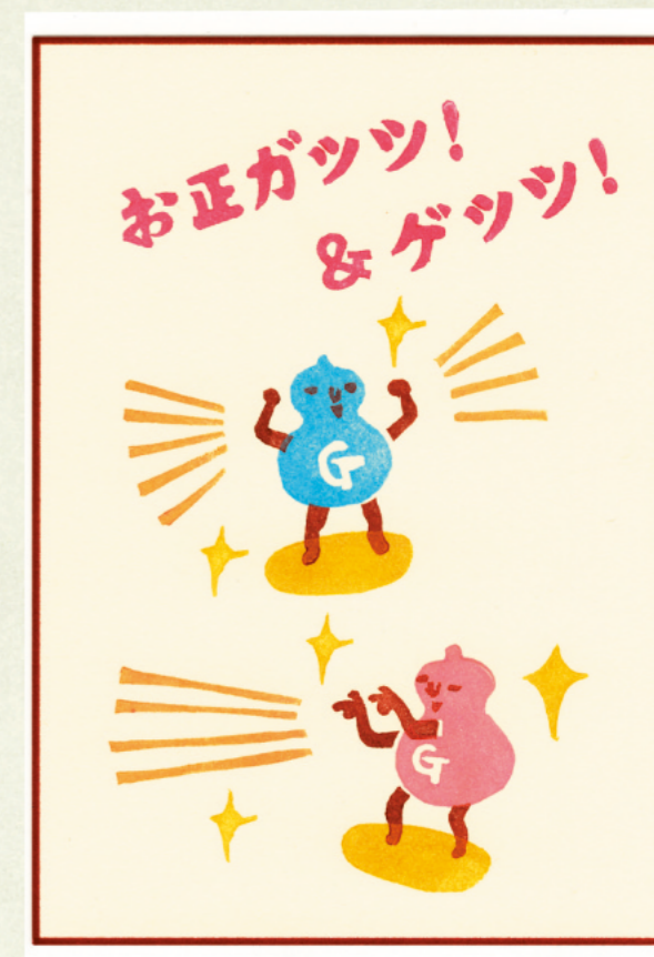
「お正ガッツ！ & ゲッツ！」 kokeshi04.jpg

※はがき素材は、長方形にトリミングされたものが付属CD-ROMに収録されています。