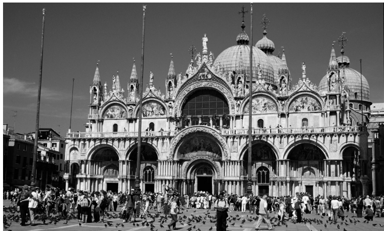
●サン・マルコ大聖堂